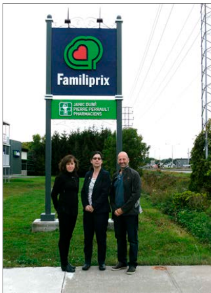
Enseigne de la pharmacie Familiprix.

Par Françoise Roy, chargée de projet Développement Côte-de-Beaupré