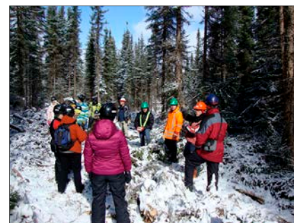
Les visites de L'Aventure forêt et bois font découvrir aux participants les diverses facettes de l'industrie forestière.

Informé toutes les générations, c'est dans notre mission ! Plus de 155 000 visiteurs uniques sur nos sites Internet, 200 000 lecteurs de nos publications et 1 800 abonnés à nos réseaux sociaux et à notre bulletin électronique.