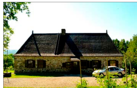
Maison Jacob et Manoir de Charleville.