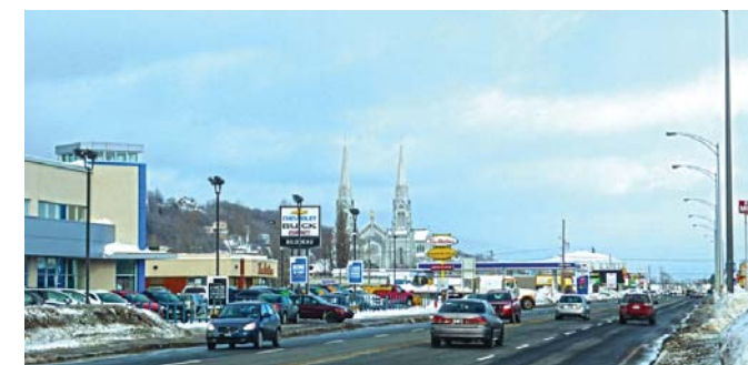
Différents types d'affichage commercial le long de la route 138, Sainte-Anne-de-Beaupré