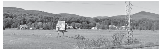
Affiche publicitaire le long de la route 138, aujourd’hui prohibé