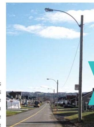
L'éclairage de certaines rues et développements résidentiels est peu adapté à son contexte paysager, produit de la pollution lumineuse et est à une échelle disproportionnée