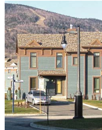
Exemples d'appareil d'éclairage à échelle humaine, Boischatel et Beaupré