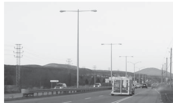
L'éclairage abondant sur la route 138 est présent partout, indépendamment du type d'unité de paysage traversé

Vérifier les programmes de subventions qu'offre Hydro-Québec.