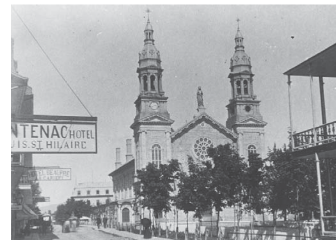
Affichage commercial sur l'avenue Royale, à Sainte-Anne-de-Beaupré, première moitié du 20 e siècle. Les différents hôtels et lieux d'hébergement pour touristes s'affichaient pour attirer la clientèle. culturecotedebeaupre.com