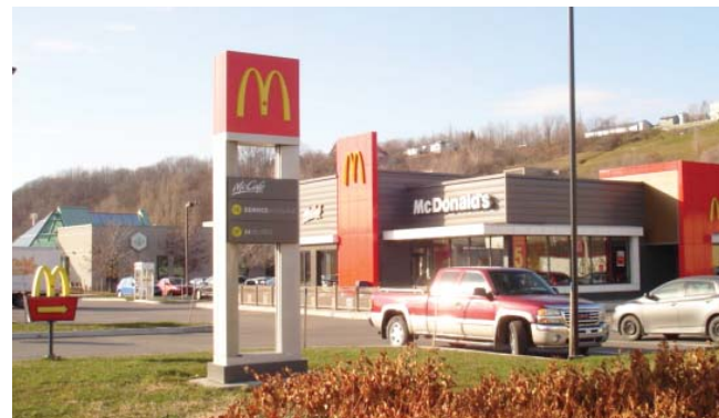
L’affichage commercial du restaurant Mc Donald’s du boulevard Sainte-Anne a été modifié en 2011. Il est possible de travailler de paire avec les grandes chaînes commerciales.

Les appareils d’éclairage, l’affiche public, les bancs, les poubelles et autres équipements du genre forment un tout : le mobilier urbain. Pour les cas d’aménagement les mieux réussis (tel que la promenade Samuel-de-Champlain à Québec), tout le mobilier urbain est développé de façon conjointe et cohérente. Le résultat est bien intégré au paysage et à l’environnement, tout en étant facilement reconnaissable.