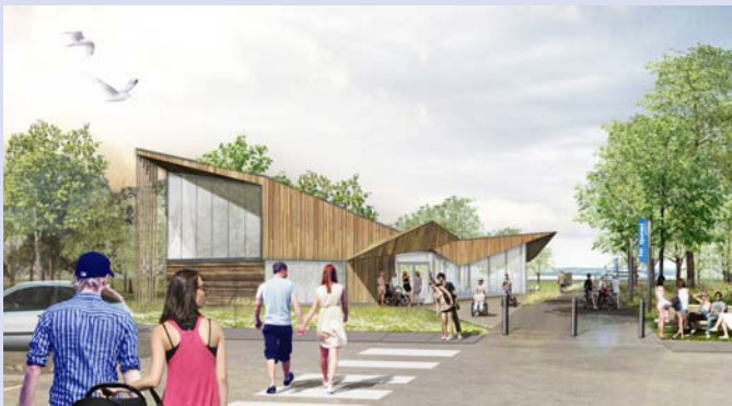
Futur projet de revitalisation du quai de Sainte-Anne-de-Beaupré.