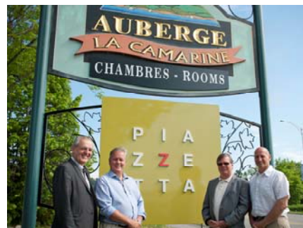
Enseigne du restaurant La Piazzetta.