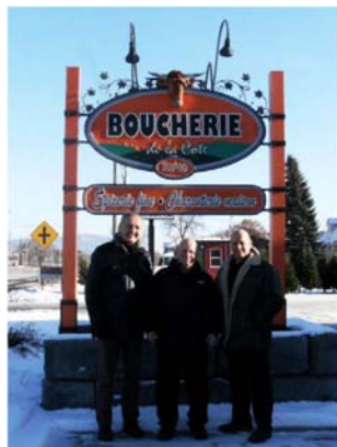
Enseigne Boucherie de la Côte.

Ce fonds s'adresse aux bâtiments de nature commerciale et industrielle situés sur la route 138, c'est-à-dire entre Boischatel et Saint-Tite-des-Caps. Les travaux admissibles concernent les enseignes commerciales permanentes extérieures et les plantations de végétaux permanents ou l'installation de matériaux servant à l'aménagement paysager. Il est à noter que les enseignes et travaux doivent être visibles de la route 138 et situés en cour avant seulement.