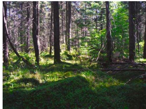
Marécage arborescent situé à Saint-Tite-des-Caps

Dans le cadre de ce projet, l'OBV-CM remettra aux propriétaires un cahier contenant une multitude d'informations sur la composition et les caractéristiques de leur milieu humide. Des recommandations pour la conservation et l'aménagement du site seront également proposées aux participants. Sur demande, dans les années suivant la signature des ententes, l'OBV-CM offrira également un suivi et un service-conseil pour les activités de protection et d'aménagement des milieux humides concernés.